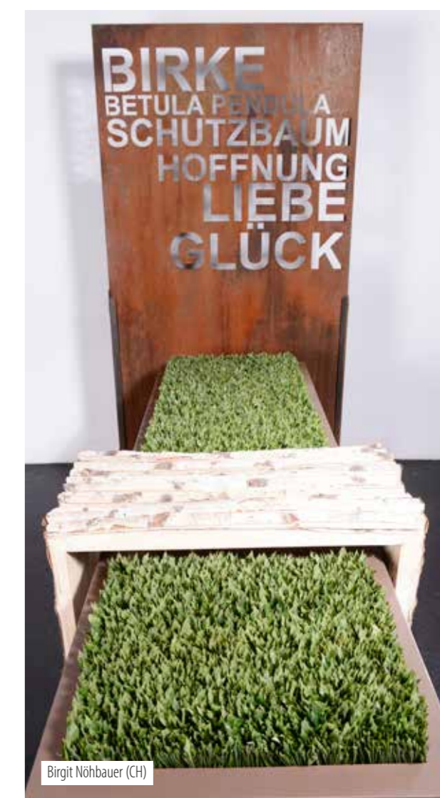
Birgit Nöhbauer (CH)