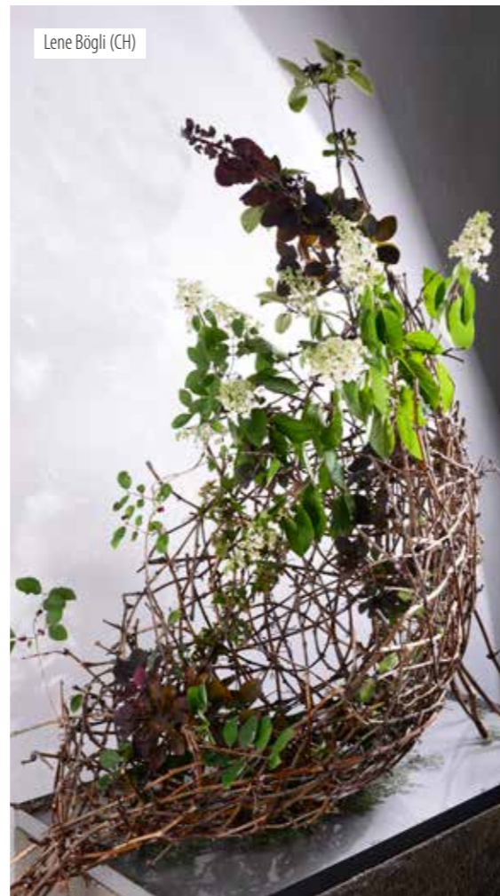
Lene Bögli (CH)